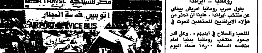
المشجعون المصريون في مطار القاهرة يستقبلون أفراد المنتخب